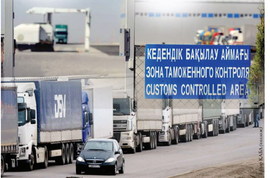
Елшір КАБА (қолы)

Бұл бизнеске түсетін ауыртыпалықты жеңілдетеді, өзара тауарайналымды еселеп арттыруы ықтимал. Осы арқылы ел бюджетіне түсетін кедендік төлемдер мен салық түсімдері артады. Бюджет толады, бұл мемлекеттің әлеуметтік, инфрақұрылымдық және басқа жобаларды жүзеге асыруына мүмкіндік береді. Мұның бәрі елдің ауқатының артуына септеседі.